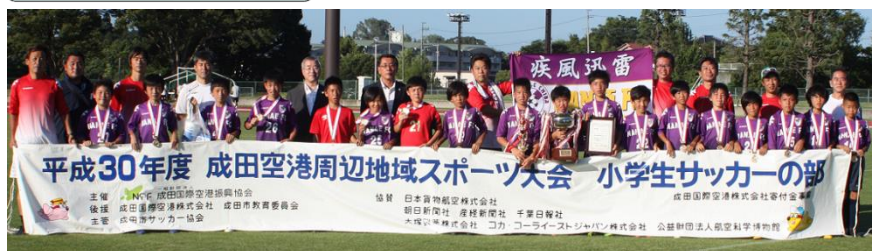
優勝を果たした「七栄FC」