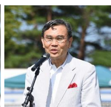
宇都宮議員による 激励の御祝辞