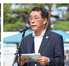
成田市サッカー協会 早乙女会長の御挨拶