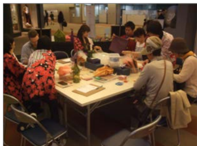
多くの方に体験していただきました。