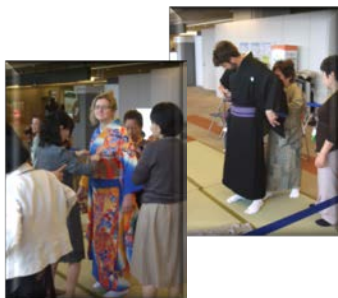
帯の締め付けにちょっと苦しそう。