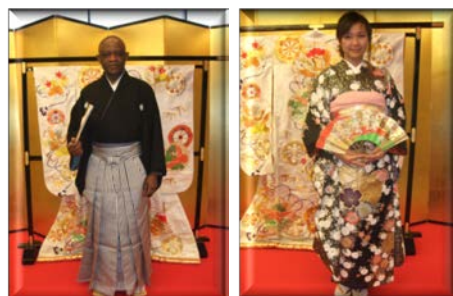
最後は素敵な笑顔で写真撮影