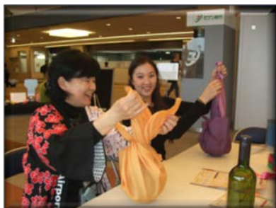
ボトルの包み方に戸惑いながらも楽しそう。