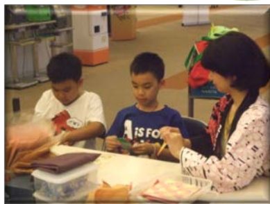
お子様も一生懸命「ぴょんかえる」作りに挑戦