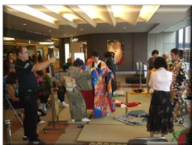
見学の方も多くいらっしゃいました。