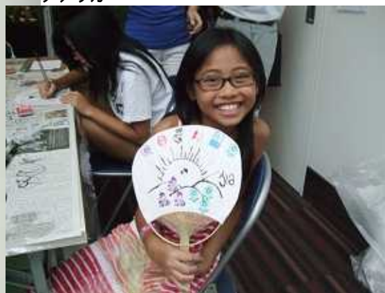
友達に自慢するそうです。 台湾