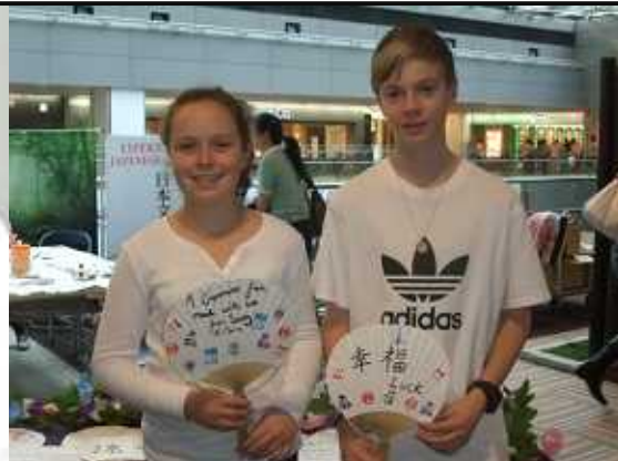
兄弟揃って、思い出の一品ができました。 オーストラリア

和紙にスタンプや文字、絵を描き、竹骨に糊をぬって和紙をはる。最後に耳紙を施す本格的なうちわです。