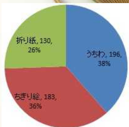
催し物別体験者数

和紙にスタンプや文字、絵を描き、竹骨に糊をぬって和紙をはる。最後に耳紙を施す本格的なうちわです。