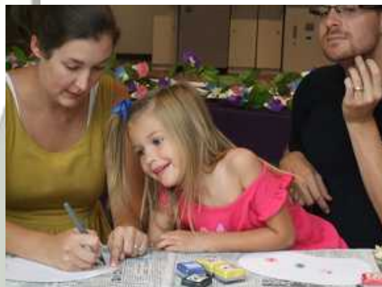
初めてのうちわ作りに興味深々！ アメリカ