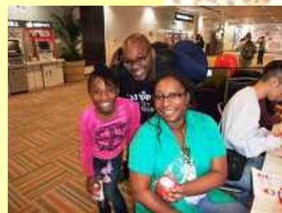
家族でみんなで楽しみました！ (だるまの絵付け)