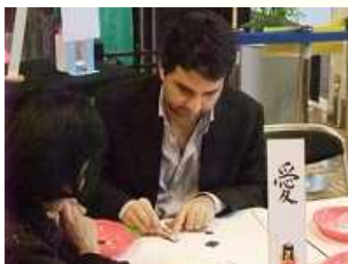
人形は顔が命！集中して・・・！ (和紙人形の制作)