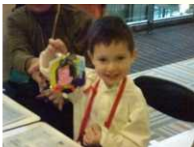
「顔をピンクに塗ったんだ！」 (凧の制作)