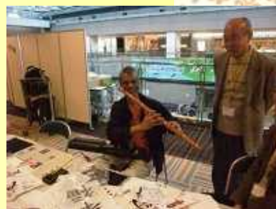
ミュージシャンであるお客様に「楽」の文字を教えてさし上げました。(書道)