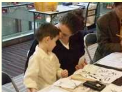
「ママ、上手に書けたよ！」 「上手に書けたね！チュッ」(書道)