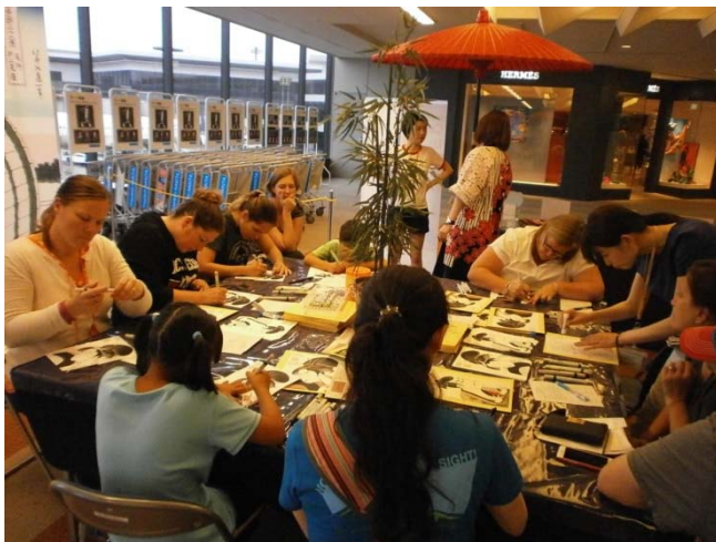
多くの方に体験いただいているイベント会場の様子