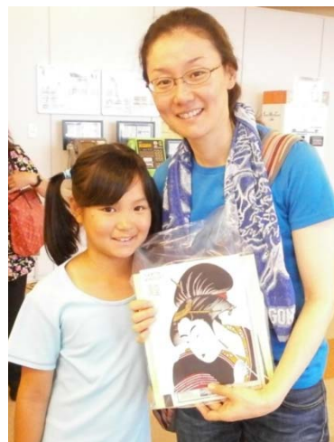
家の玄関に飾ると話していた台湾からの親子。