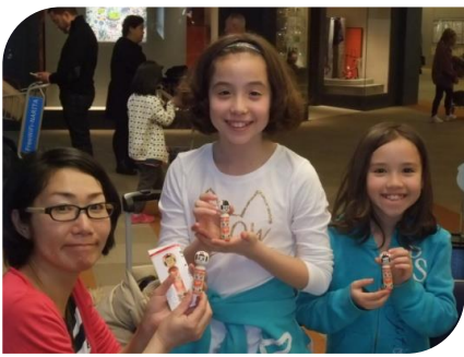
出発までの長い待ち時間を子供達と楽しく過ごすことができました。(アメリカ)