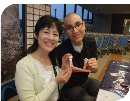
転勤で佐世保からフロリダへ行きます。(アメリカ・日本)