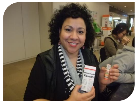
2歳になる娘の顔に似せて作りました。(トリニダード・トバゴ)