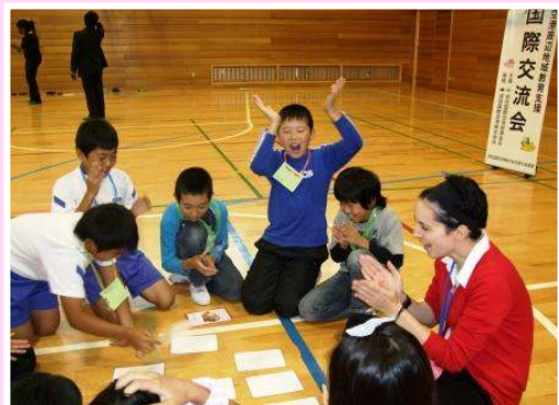
カードゲームで楽しく学習